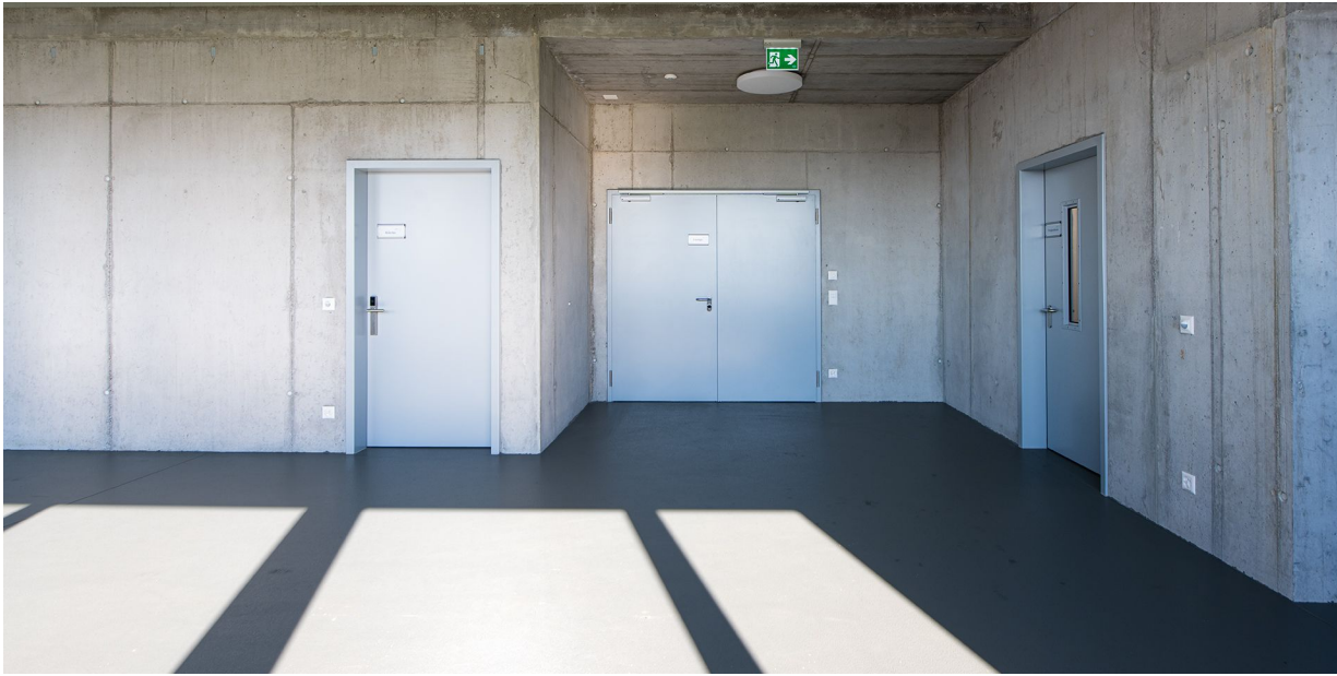
Stahl-Feuerschutztüren STU-1 Ei2 30 C und Stahl-Feuerschutztür STU-2 Ei2 30 C